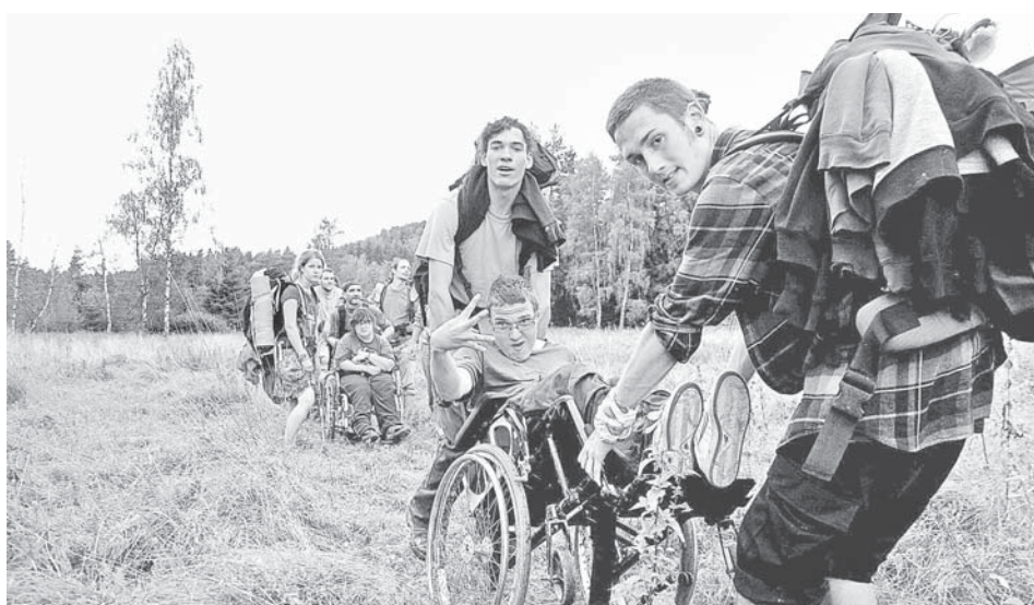
Kdo komu asistuje? Na akcích Ramusu se rozdíl stírají a spoustu legrace si užijí úplně všichni.